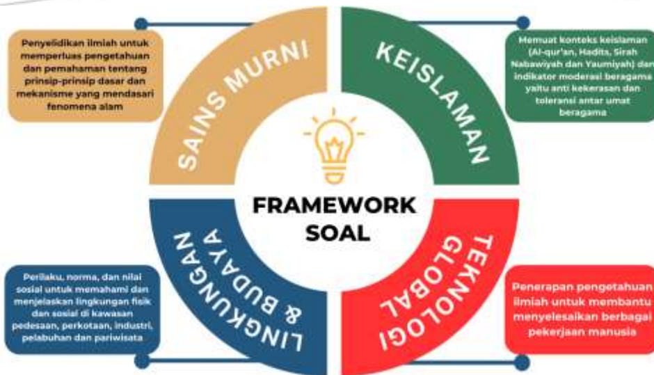
Gambar 1. Framework KSM Tahun 2024

Adapun karakteristik soal yang dikembangkan dalam KSM 2024 adalah: (1). Simple Problem . Soal ini memiliki karakteristik berupa pilihan jawaban (choice problem) dengan struktur masalah yang lengkap ( well-structured ); (2). Partial Problem . Soal ini memiliki karakteristik antara pilihan jawaban ( choice problem )/masalah desain ( design problem ) dengan struktur masalah yang lengkap/tidak lengkap ( well and ill-structured ); (3). Complex Problem . Soal ini memiliki karakteristik berupa masalah desain ( design problem ) dengan struktur masalah yang tidak lengkap ( ill-structured ). Karakteristik soal KSM 2024 dapat digambarkan sebagai berikut: